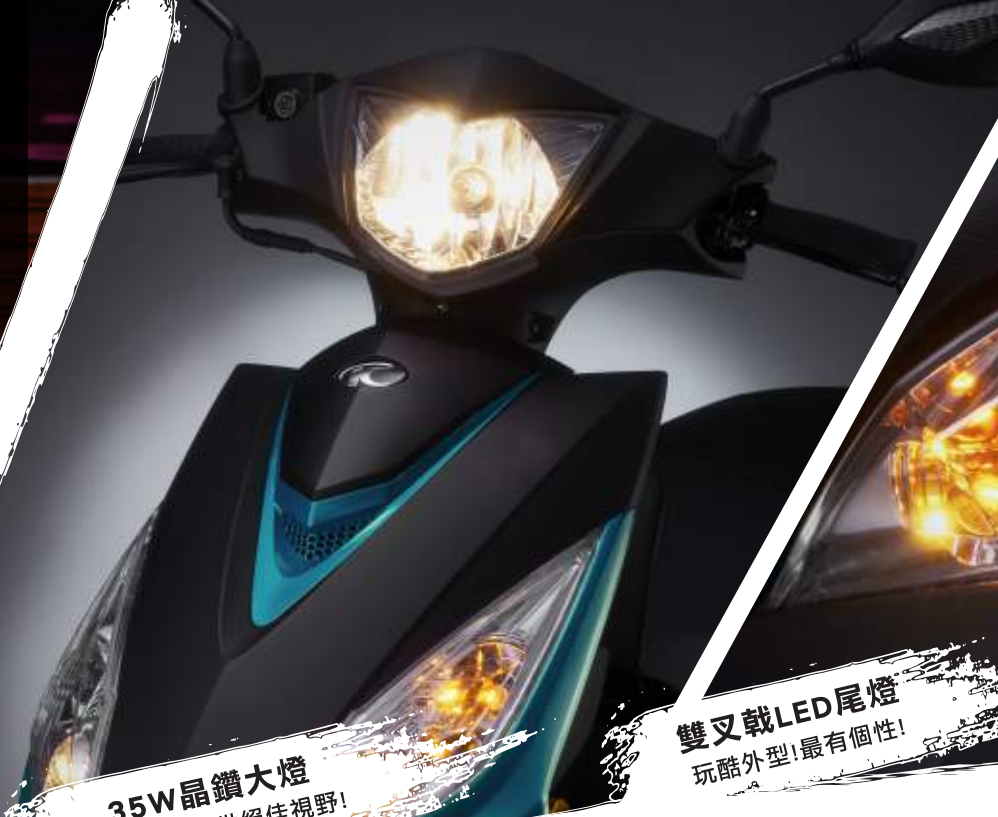
35W晶鑽大燈 閃亮耀眼！提供絕佳視野！