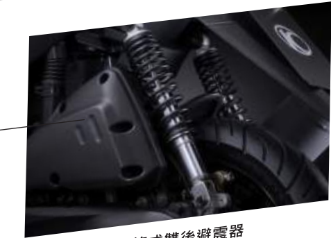
複筒式雙後避震器 性能提升！穩定加倍！