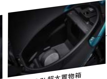
15.7L超大置物箱 大容量！放就對了！