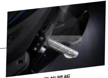
飛旋踏板 瀟灑一壓輕鬆使用！