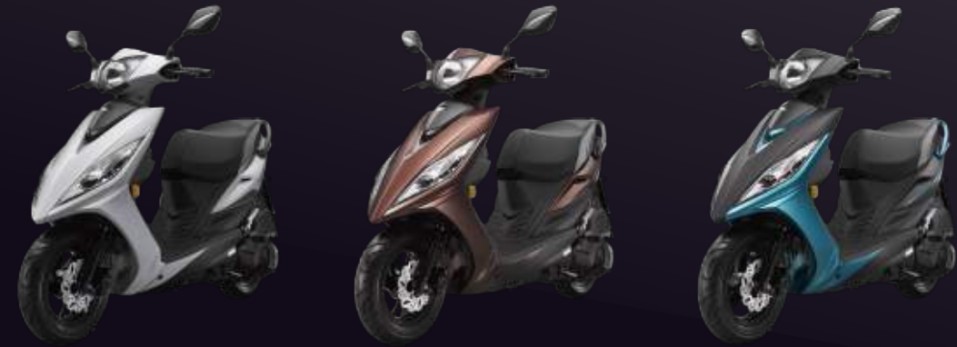
NH193PE 珍珠白 Pearly White