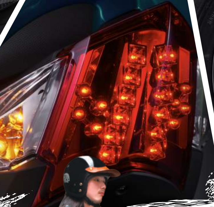
180MM浪花碟 超煞！最敏捷的制動力！