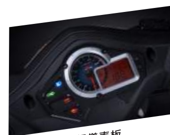
飛行儀表板 獨特液晶炫彩！最有態度！